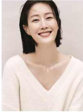
세계적인 탑모델 '이현아'