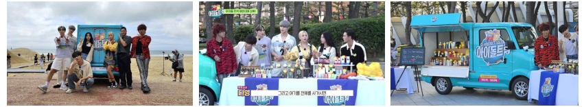
<2023년 아이돌 트럭 콘텐츠의 예시>