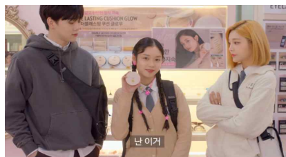
* 본캐릭터 이미지는 AI를 통해 생성